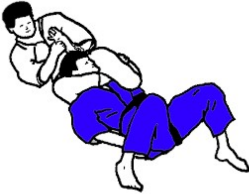
SANKAKU-GATAME CLÉ EN HYPEREXTENSION EN TRIANGLE