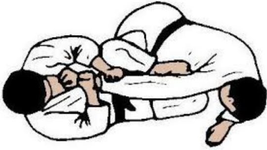
HIZA-GATAME CLÉ EN HYPEREXTENSION À L'AIDE DU GENOU